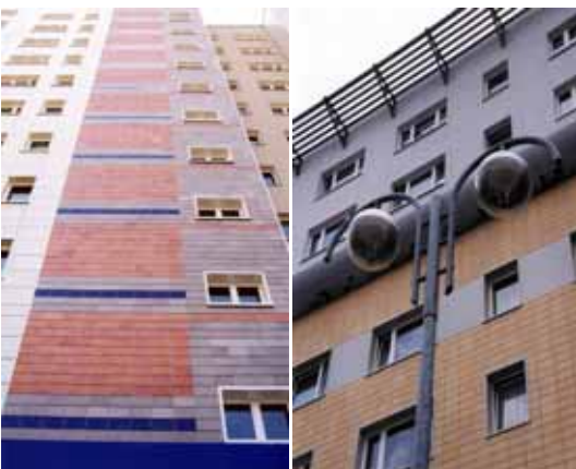
Vorgehängte, hinterlüftete und wärmege- dämmte Keramikfassaden EURACON KH-610 aus Crinitzer Steinzeug-Keramik

EURACON Fassadensysteme GmbH Zentrale Berlin Puschkinallee 3, 12345 Berlin Telefon: 030 - 421 98 190 Telefax: 030 - 421 98 195